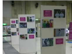
昨年度の会場の様子

福祉の現場で働く方の笑顔の写真（A3サイズ）を展示するスペースを会場に設けます。写真は、事前に日程を調整し、各事業所を訪問のうえ撮影させていただきます。モデルとなる職員の方は1人でも複数でも構いません。下記を参考としてください。また、写真は後日プレゼントします。